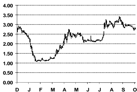
Цена на акцията на Първа инвестиционна банка

Цената на акцията на ПИБ продължи да пада под влиянието на общата слабост на пазара след тримесечните отчети. Коефициентите са около средното при сравнение с другите български публични банки. Въпреки това, увеличаването на необслужваните кредити може лесно да промени картината. Коефициентът цена/активи е 0.08, докато цена/счетоводна стойност е 0.78.