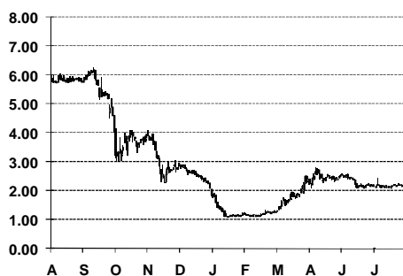
Цена на акцията на Първа инвестиционна банка

Цената на акцията на ПИБ нарасна след отчета, но обеите останаха под средното за търговията по позицията. Показателите на банката са сред ниските в сектора. Коефициентът цена към активи е 0.06, докато цена/счетоводна стойност е 0.61 и ПИБ вече не е подценена в сравнение с останалите публични банки.